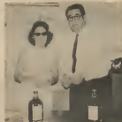
Ira de Wmit, di Wrastra 31, Ompital